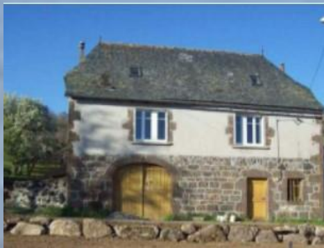
Gîte du Salt-Bas