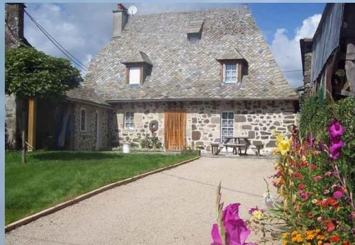
Gîte de Sarrans