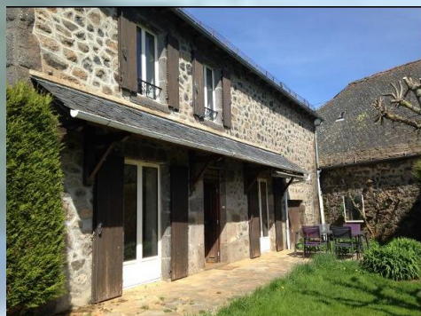
Gîte Famille Veyres - Jongues