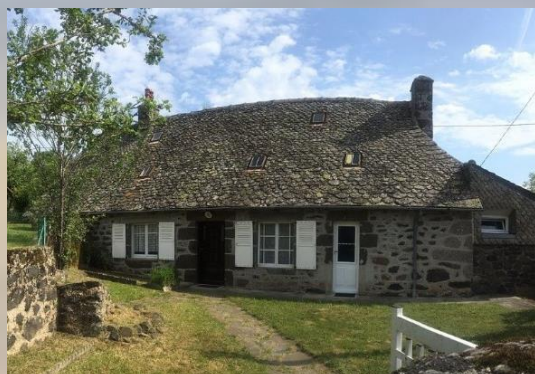
Gîte du Lilas - Bussières