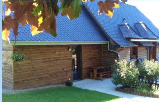
Chalet Claire Prunet - Brommat