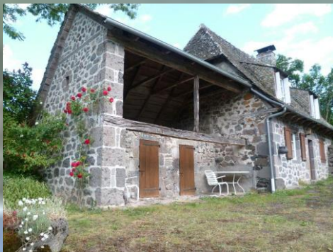
Gîte de La Borie