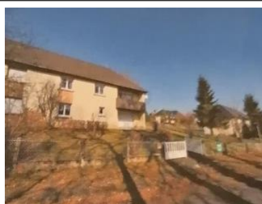
La Sapinière Maison T5