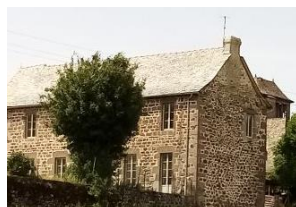
Albinhac 2 logements T4 au presbytère