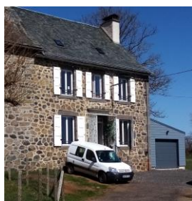
Jongues maison T4