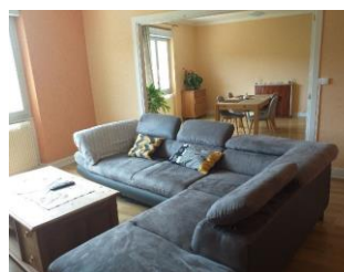
Brommat Appartement T4 au-dessus de l'école